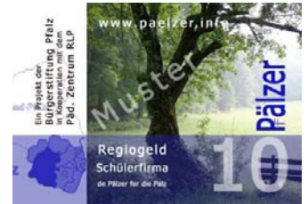
Abb. 11: Flyer, Muster „Pälzer“ Vorderseite