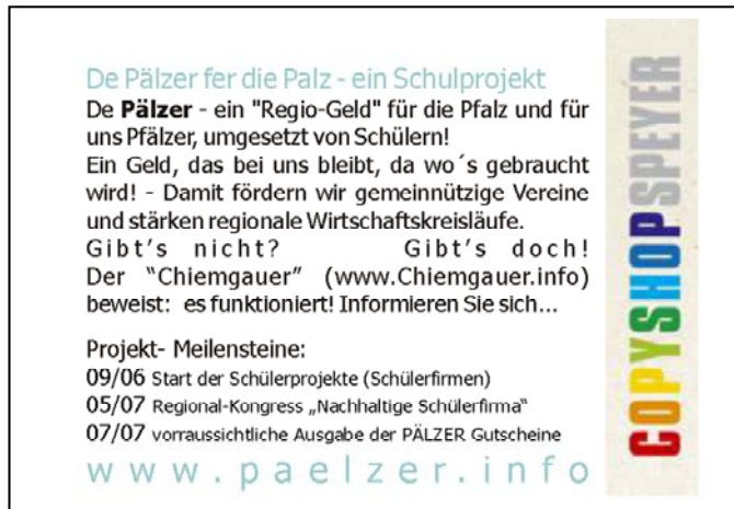
Abb. 2: Flyer: Muster „Pälzer“ mit Projektbeschreibung Rückseite