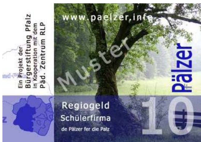
Abb. 1: Flyer: Muster „Pälzer“ Vorderseite

Auf dem Rheinland-Pfalz-Tag vom 19. - 21. Mai 2006 in Speyer war die Bürgerstiftung Pfalz mit einem eigenen Informationsstand vertreten. Dort wurde das Projekt mit dem hier gezeigten Flyer präsentiert. Sie zeigen den einen fiktiven "Pälzer" in Musterform.