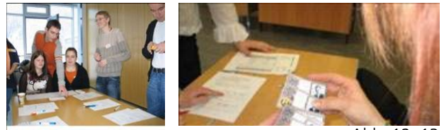
Abb. 12, 13

Das Geldspiel kann erweitert oder variiert werden, indem eine Software, die einen Tauschring simuliert, im Computerraum installiert wird. Die Schüler tauschen virtuell im Klassenverband. Sie überlegen, was sie persönlich als Ware oder Dienstleistung anbieten können. Ihr Selbstvertrauen wird gestärkt, da sie eine Gegenleistung für ihre Leistung erhalten oder erwarten können. [Im September 2006 startet an der Regionalen Schule in Rülzheim ein erster Modellversuch in Zusammenarbeit mit dem Regio-tauschnetz Kandel (Verweis: www.regiotauschnetz.de ).]